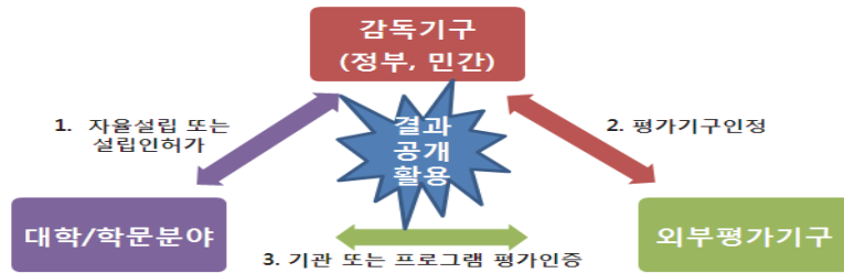
〈그림 1〉 경영학(회계학) 학문분야 평가·인증제에서 교육품질삼위 일체의 역할관계

부)’ - ‘외부전문평가기구(한국경영교육인증원)’의 역학구도를 형성하고 있다.