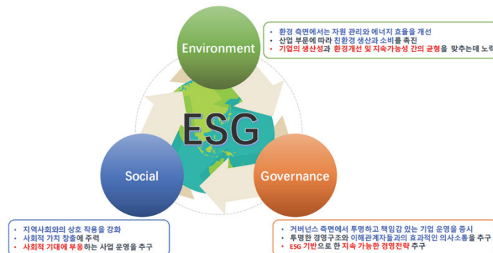
<그림 2> 코린도 그룹의 ESG 경영

코린도 그룹은 창립 이래 지속적으로 성장하고 있으며 다양한 산업분야의 다각화 전략을 추진하고 있는 기업이다. 특히 현지화와 더불어 ESG 경영을 활용하여 사회적 가치 창출에 노력하고 있다. 다음에서