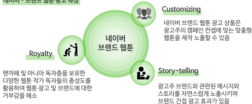
네이버 - 브랜드 웹툰 광고 특징