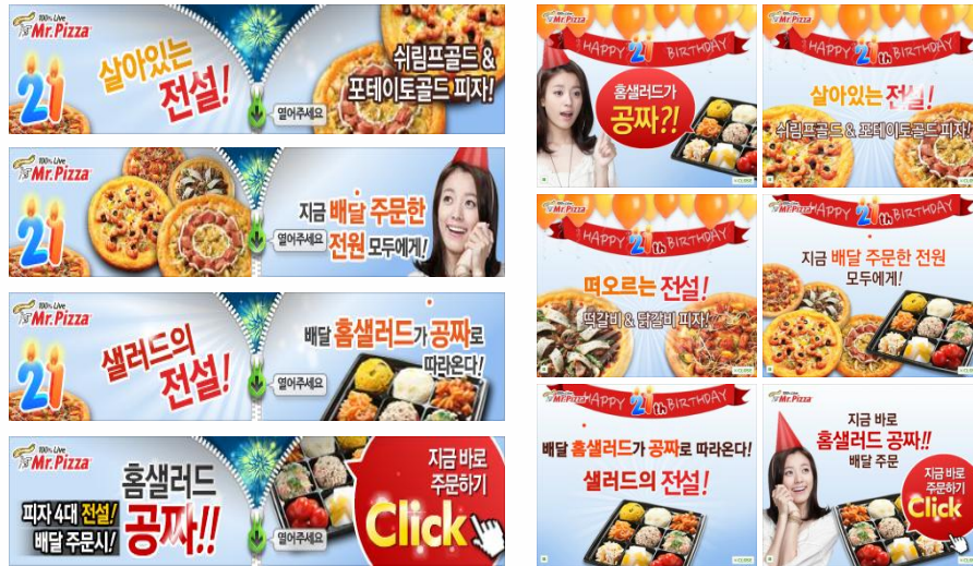
[ Banner Creative ]