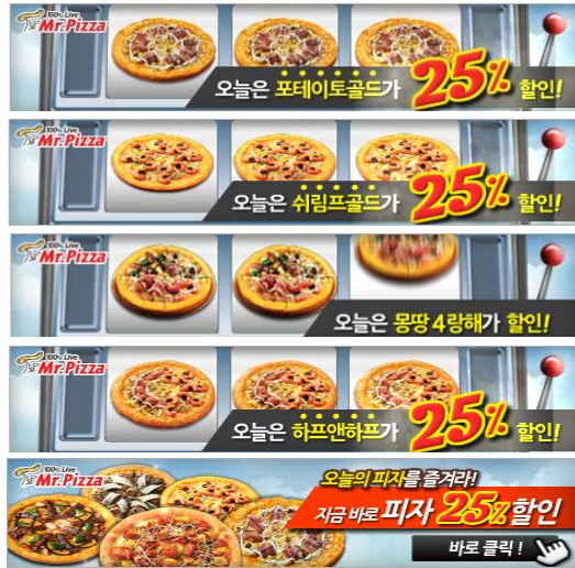
[ Banner Creative ]