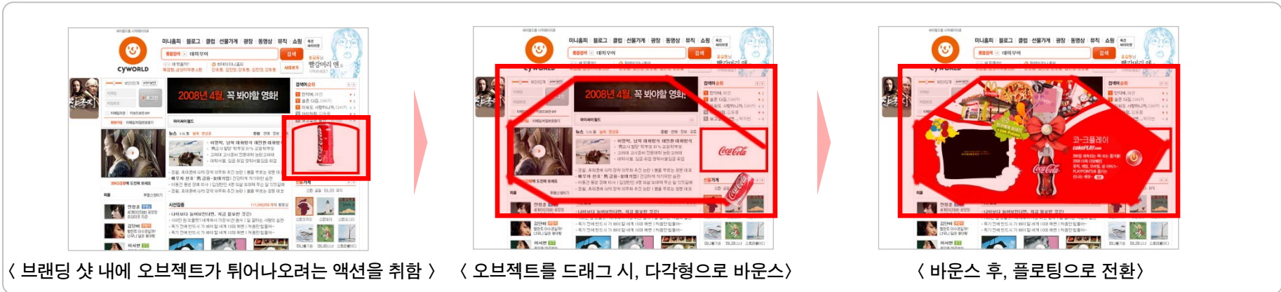
< 브랜딩 샷 내에 오브젝트가 튀어나오려는 액션을 취함 >

- 브랜딩샷 내의 오브젝트를 드래그하면 다각형으로 바운스되는 형태의 일고정상품