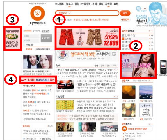
< 개편 후 >