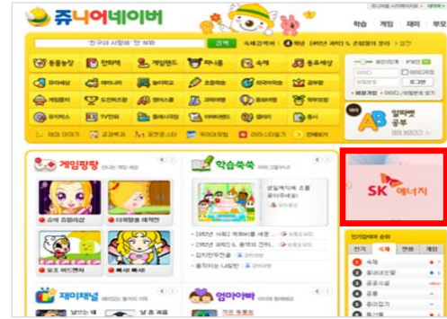
< 개편 후 >