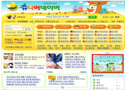
< 개편 전 >