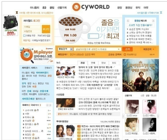
< 개편 전 >