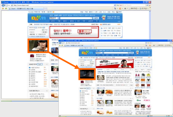
[ 다음 초기 TV팟 플레이어 ] 스페셜 영상 노출로 효과 극대화