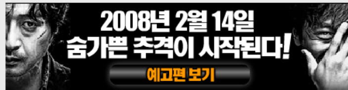
[ 티징 광고 - 1/2 ~ 1/3 ]