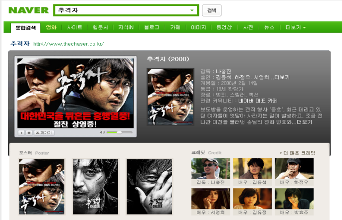
[ 네이버 통합검색 페이지 ]