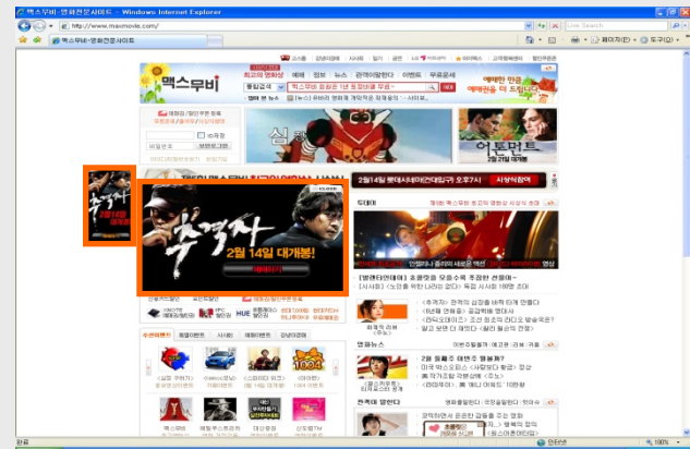
[ 맥스무비 필름/스크린연동배너 ] 개봉시점에 맞춰 영화매체 고정배너 3일 노출