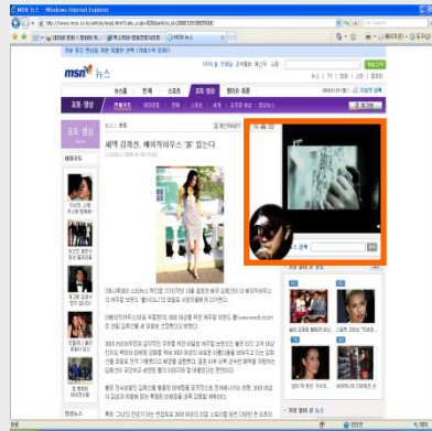
[ MSN 플래시 에이전트 동영상 빅배너 ] CTR : 1.30%