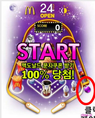
클릭 시 게임 시작