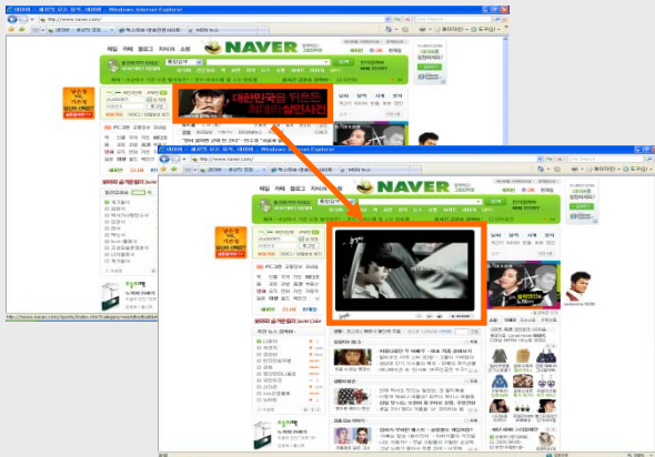
[ 네이버 메인익스팬더블 ] 네이버 메인 영역에 개봉 주까지 총 12.5구좌 영화 예고편 노출